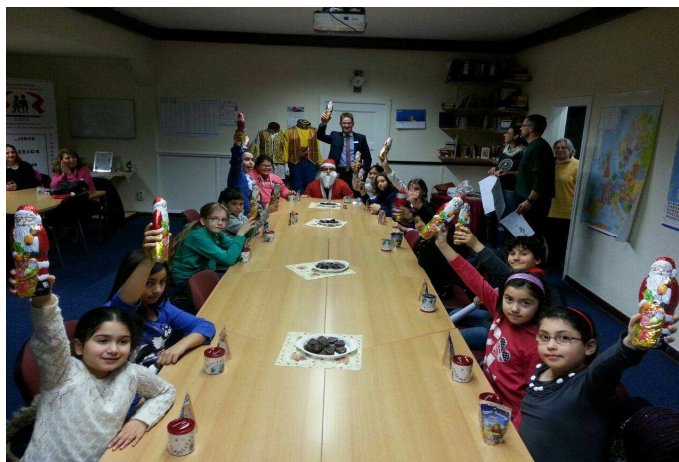
Ein Bild vom Abschluss

Alle Bilder werden insgesamt 2 Wochen in der Bank ausgestellt.